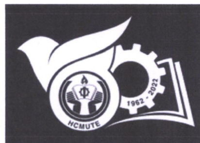
Biểu trưng đơn sắc